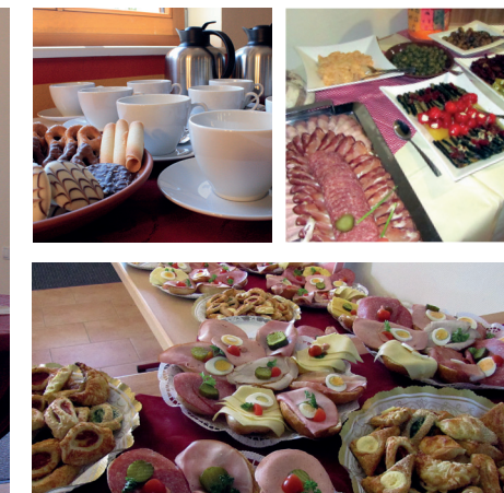
Integrierte Küche & Buffet-Bereich