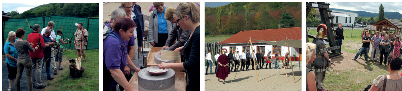
Bogenschießen Backtag Auxiliarausbildung Erlebnisführung